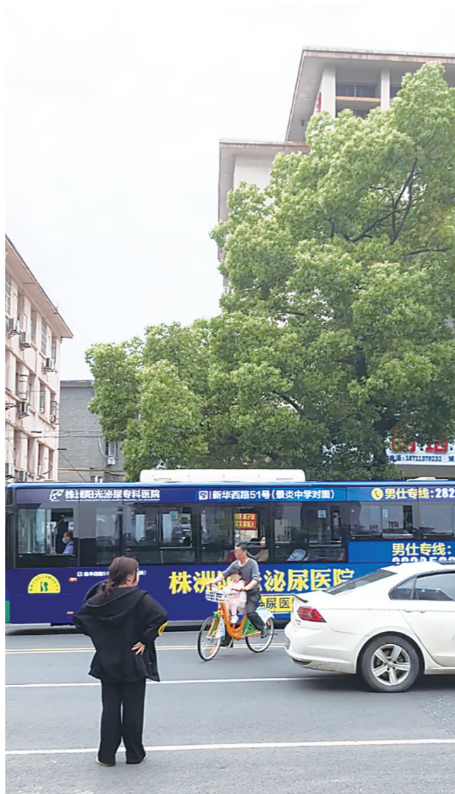
杉木塘五金机电市场门口,一名男子骑自行车载着幼童越双黄线横穿马路。

他们认为,市民中的不文明交通行为仍不同程度存在,要形成文明礼让良好风气,还任重道远。