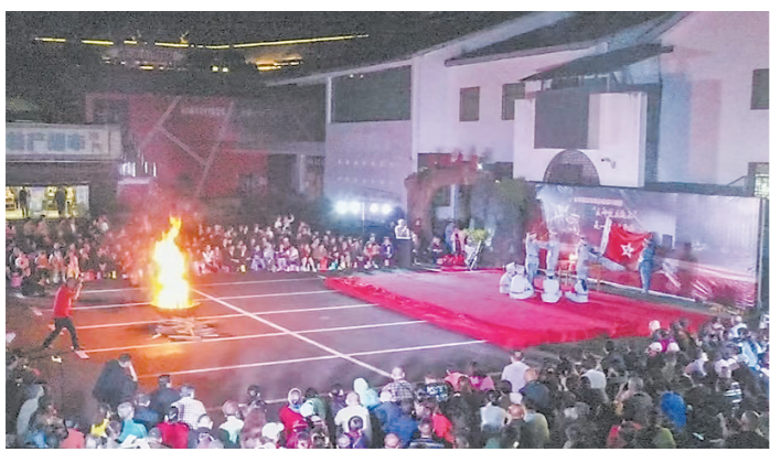
民俗文化节篝火晚会。

4月22日,2023年株洲市第二届旅游发展大会之系列活动神农谷第一届民俗文化节,在炎陵县举行。广大游客与当地畲族村民一起,参与民俗活动,领略民族风情。