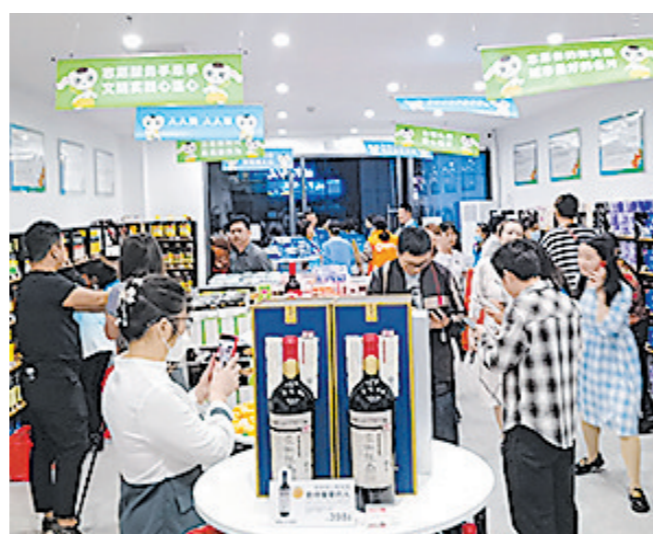
“城市有心屋”里宾客盈门。

日前,在株洲市天元区苏宁商业街上,新开张的“城市有心屋”宾客盈门。这是株洲市首家服务于志愿者的专属小屋,售卖米、油、纸、生活日化等商品,志愿者可以用“志愿积分”兑换这些商品。