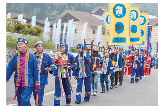
▲苗族祭祖游行。

本报讯(株洲晚报融媒体记者/肖捷 通讯员/张和生)临近“五一”，炎陵县神农谷已提前热闹起来。4月22日，2023年株洲市第二届旅游发展大会系列活动“神农谷第一届民俗文化节”在炎陵神农谷景区举行。当天，神农谷景区吸引了两千多名省内外游客前来观光打卡。