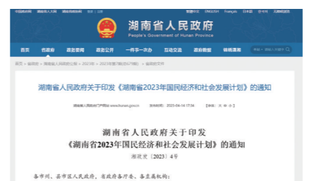
▲《湖南省2023年国民经济和社会发展计划》截图。

间不存在限制，这样可以有效带动人才要素在区域中的有效流动，促进区域城市化发展。而从“楼市长期看人口”的角度来看，今后人口流入的地方，楼市的前景都将被看好。