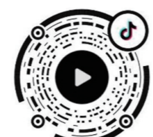
▲打开抖音扫码观看视频。