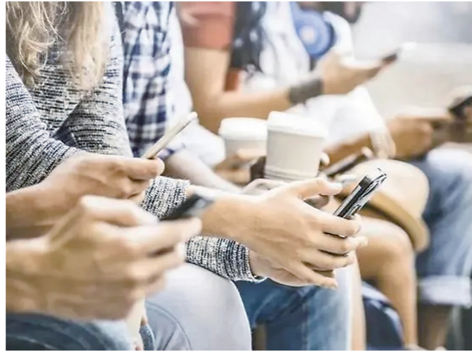
▲数字产品让人沉迷其中。

除了糖、薯片、酒精、咖啡等容易让人成瘾的物质,20年前,一种全新的“电子设备成瘾症”出现了:社交软件、网络购物、短视频。这些数字产品让人沉迷其中,闪烁的灯光、庆祝的声音和“点赞”,使人们渴望获得更大的奖励。然而,人们也发现,当快乐变得唾手可得,却更容易感到迷茫,更容易迷失自我,甚至感受不到幸福。以至于网上出现了这样的声音:为什么我们越来越容易获得那些令人快乐的东西,但却变得比过去更加痛苦?