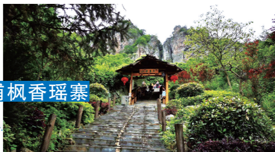
怀化溆浦枫香瑶寨