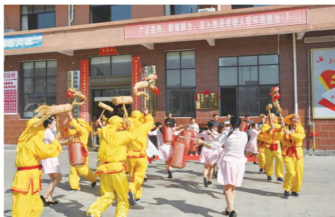
茶陵客家火龙表演。