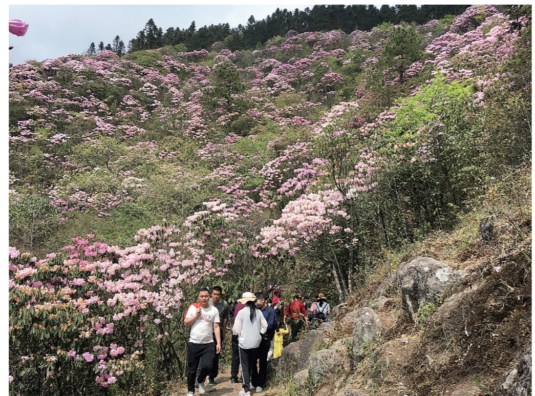
万亩云锦杜鹃花海引得游客流连忘返。

株洲日报(全媒体记者/黎世伟 通讯员/张和生 卢姣梅 郭幸鹏)在这最美人间四月天里,炎陵县万亩原生云锦杜鹃惊艳绽放,形成一片浪漫的花海,粉面含春迎客来。4月8日,2023年云上大院云锦杜鹃花节在炎陵县云上大院景区举行。