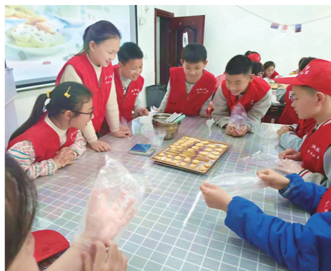
▲做饼干活动中,校园记者互相协作。