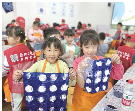
▲“看看我做的扎染作品!”