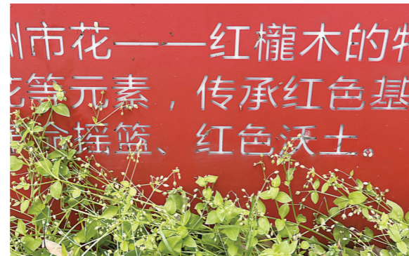
▲红櫟木的“櫟”字被刻成“木龍”字。

本报讯(株洲晚报融媒体记者/刘平)樟树为株洲市市树,红櫟(jì)木为株洲市市花……对于株洲的市树、市花,广大市民并不陌生。但4月1日,天元区街头一处生活垃圾分类吉祥物上对市花的称呼,让一名小学教师“犯难”了,原来是出现了错别字。