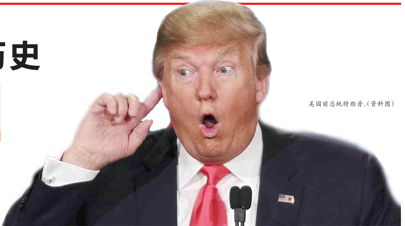
美国前总统特朗普。(资料图)