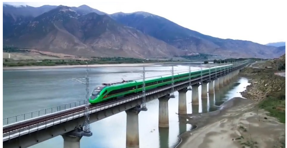
中车株机公司牵头研制的复兴号“绿巨人”列车。