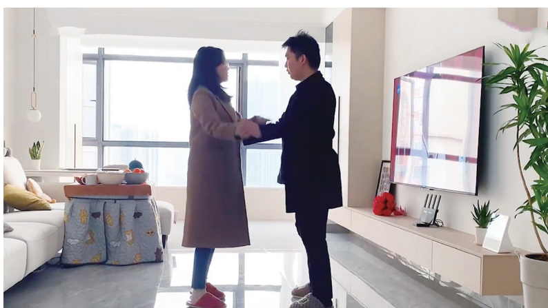
何先生和妻子在温馨小家。