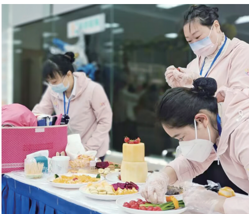
培训学校教师在“311就业服务日”现场展示烘焙、摆盘等技能。

与此同时,我市引进符合省级关键人才的高层次人才66人,完成年度任务的388.23%,引才质量和数量始终处于全省前列。新认定高层次人才456人、安家补贴发放对象17人。欧科亿、华锐获批设立国家级博士后科研工作站,实现全市国有大型企业、民营中小企业类别全覆盖。举办全省首场、全市首次轨道交通等先进制造业高级职称专场评审,107人获