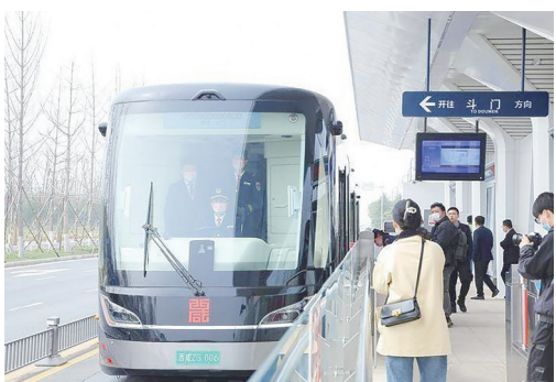
智轨示范线1号线开通现场。

3月21日,西北地区首条智轨线路陕西省西咸新区智轨示范线1号线(首通段)正式开通运营。该线路位于陕西省西咸新区沣东新城,线路起于斗门站,止于欢乐谷站,全长11.9公里。先期将开通斗门至昆明池段4座车站,约6.5公里。