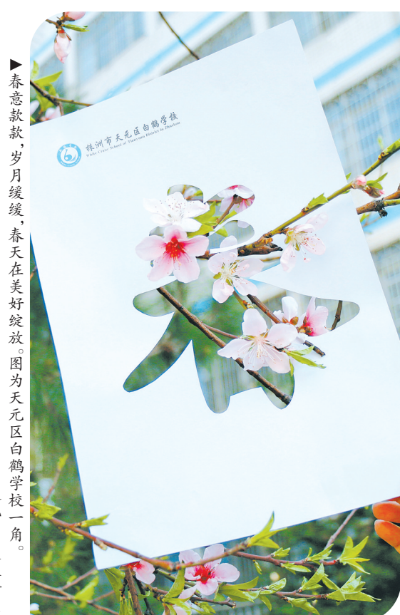
▲春意款款，岁月缓缓，春天在美好绽放。图为天元区白鹤学校一角。