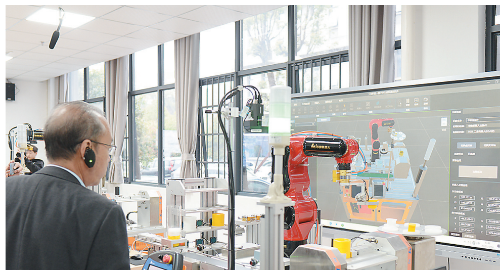
通过数字孪生技术，学生可多角度进行实操。

株洲日报讯（全媒体记者/戴灏 通讯员/周扬莉）用手机扫一扫，就能将汽车零件的构架和拆装步骤收入“掌中”，登录“工匠e站”平台，就能看到学生成长画像，甚至匹配岗位……3月17日，全国职业院校数字化校园示范校建设观摩活动在湖南汽车工程职业学院举行，来自教育部和全国130余所职业院校的200余名代表走进校园，共享这场丰富的“智慧大餐”。