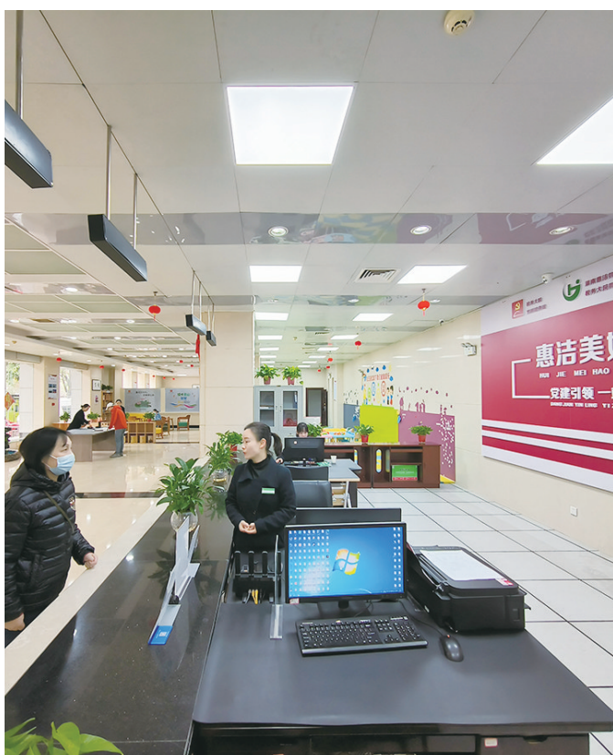
怡景苑小区的闲置房屋变身一站式服务中心。

该小区还成立了“幸福大院共建委员会”,组建了由小区党支部、物业党支部、业主委员会、居民代表组成的四方议事体系,涉及小区维修基金使用、公共设施维修、新增相关公共设施等有关小区建设和管理事项,都要在广泛听取业主意见的基础上,经四方议事成员达成一致后,方可实施。同时构建小区“共建共享共治”治理新格局,带动居民主动参与小区治理。