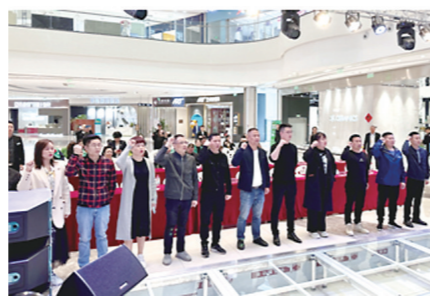
▲品牌商代表诚信宣誓。

本报讯(株洲晚报融媒体记者/郑炜青 通讯员/易水寒)3月15日上午,“提振消费信心·服务进小区”及全城换新季活动启动会在喜盈门(株洲)建材家具广场举行。