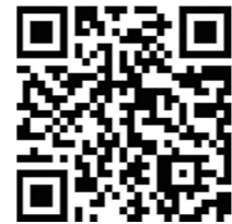
▲以旧换新活动,扫码进入。

该活动是万博珑响应“老旧小区改造”计划,贯彻落实“诚信服务宗旨,打造健康人居生活”为目标而开展的惠民活动,今年是第二季。启动仪式上,除服务承诺签约仪式和品牌商代表诚信宣誓外,还推出一项免费服务进小区的家政服务公益活动,即从今年3月15日至4月2日,凡株洲市城区内有以下需求的业主,均可以在服务进小区时进行现场报名,全城限量1000户;免费床垫除螨(每户限1张);入户门锁免费保养;洁具清洁保养。有需求的市民,可尽快报名。