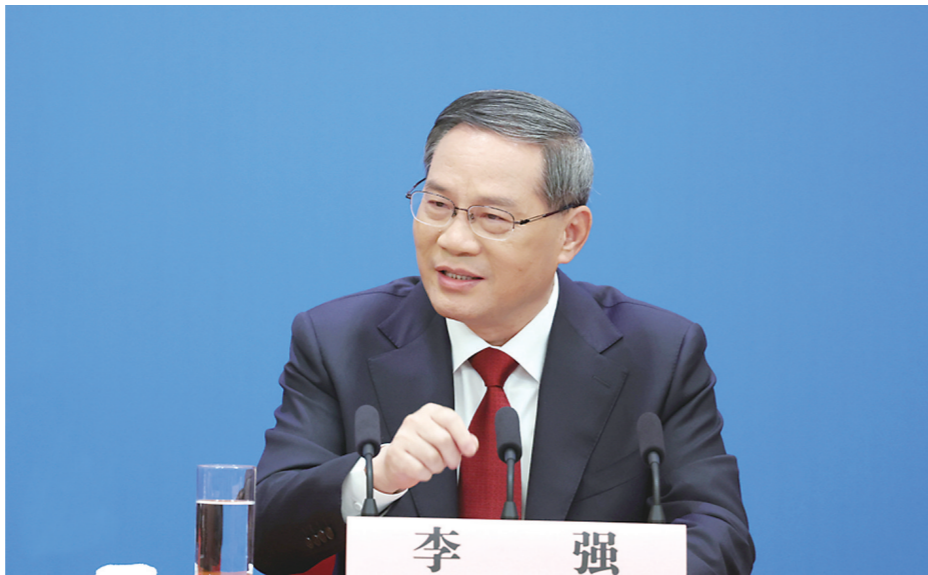
▲3月13日，十四届全国人大一次会议在北京人民大会堂举行记者会，国务院总理李强出席并回答中外记者提问。

3月13日上午，十四届全国人大一次会议闭幕后，国务院总理李强出席记者会并回答中外记者提问。“吃改革饭、走开放路”，中国经济“长风破浪，未来可期”，“高手在民间”……李强总理集中回答了关于中国经济、对外开放、政府自身建设等一系列问题。