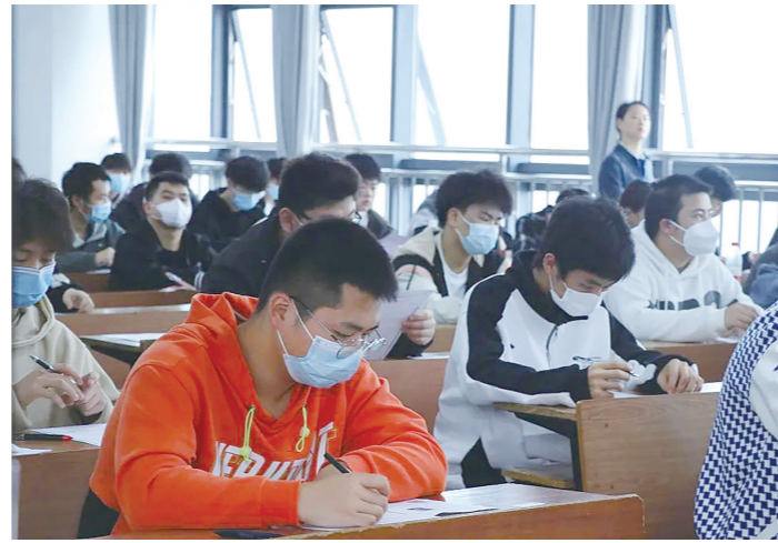
湖南汽车工程职业学院考点内,考生在认真作答。

记者在现场看到,公安、交警、城管等部门派出220名人员协助院校维持秩序。市公交公司专门增设“职教城院校单招考试专用公交线路”,切实保障考生出行。职教城派出所在校内设置准考证打印处,专门为考生解决携带身份证、准考证缺失等问题。各部门相互配合、通力合作,确保7个考点秩序井然,单招考试顺利完成。