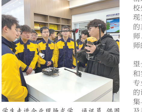
学生走进企业现场求学。

株洲日报讯(全媒体记者/戴凇 通讯员/刘红亚)日前,在我市某测绘公司的高精地图实验室内,由湖南汽车工程职业学院校企联合组成的双导师团队,正为智能网联专业的学生们讲解着高精地图编绘的“开学第一课”。