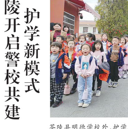
茶陵县明德学校外,护学人员时刻关注离校学生状况。

株洲日报讯(全媒体记者/戴凇 通讯员/王博林 汤正芳) 学校护学人员动起来,反光背心穿起来,口号喊起来,旗帜舞起来,工作群活跃起来。3月8日,茶陵县教育局联合县交警大队,组织全县各校180余名护学骨干力量,开展护学岗培训,开启“五个起来”警校联合共建护学新模式。