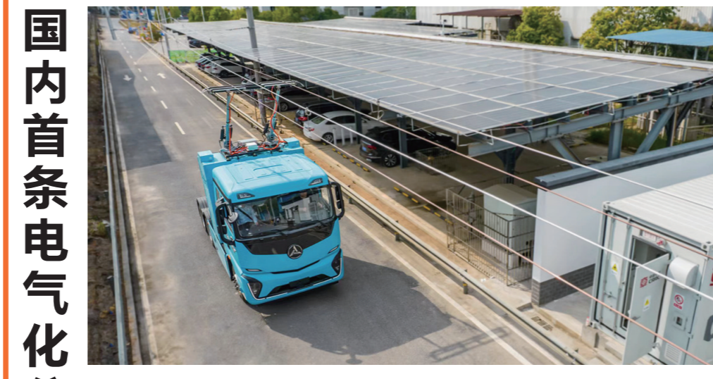
中车株洲所牵头研发并在株建设的国内首条电气化高速公路示范线。

坚持以人民为中心,不断实现人民对美好生活的向往,离不开坚强的法治保障。 社会在变,工作方式在变,警察的为民情怀不变。聚焦人民群众的所需所盼,坚持什么问题突出就重点解决什么问题,株洲公安民警深入开展“打现行、保民安”专项行动,以辛苦指数换取群众的平安指数、提升群众的幸福指数,为“培育制造名城、建设幸福株洲”贡献了警队力量。 人民警察为人民,更多的警察为民故事将继续呈现。