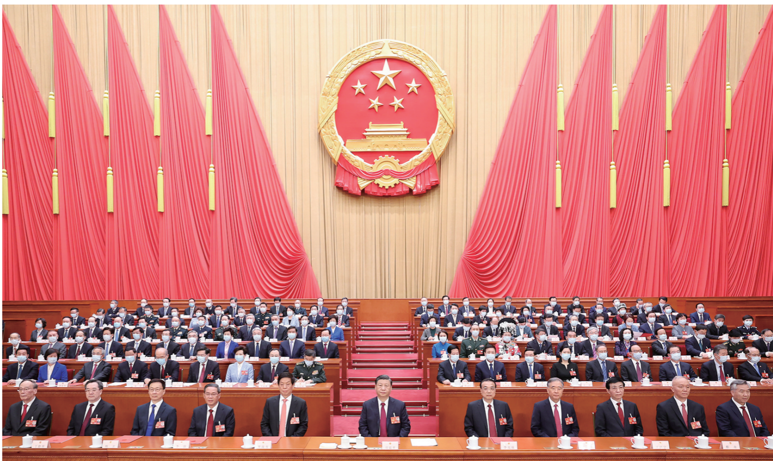
3月13日，第十四届全国人民代表大会第一次会议在北京人民大会堂闭幕。习近平等党和国家领导人在主席台就座。