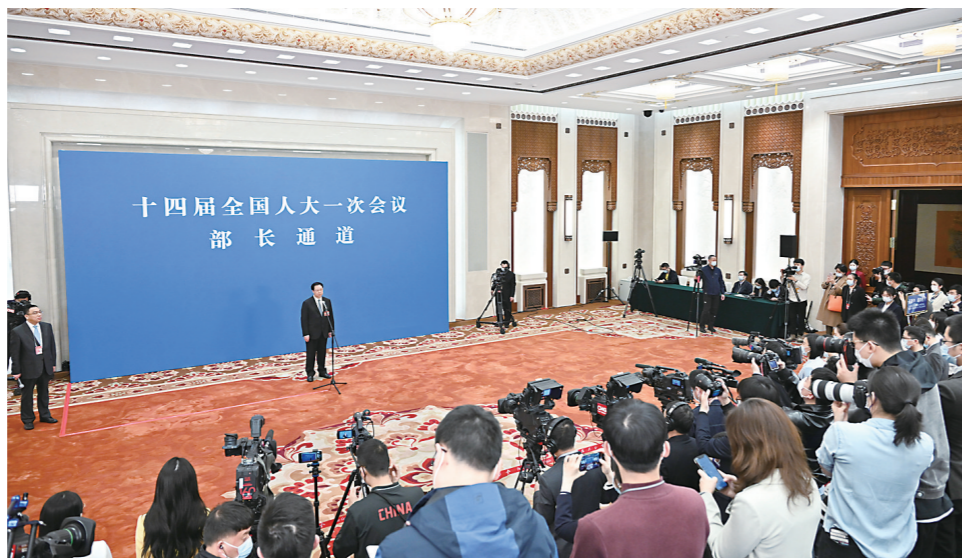
▲3月12日，自然资源部部长王广华接受媒体采访。

■在抓好后备人才的过程中，我们要坚决摒弃急功近利的心态，一步一个脚印地打造后备人才培养和成长的路径和通道，久久为功，振兴中国足球。