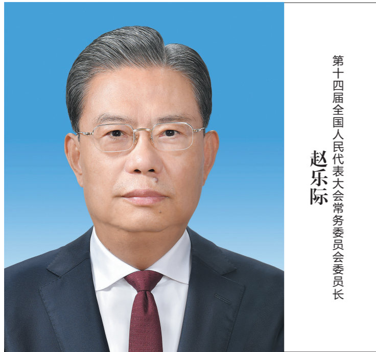
第十四届全国人民代表大会常务委员长 赵乐际

赵乐际,男,汉族,1957年3月生,陕西西安人,1974年9月参加工作,1975年7月加入中国共产党,北京大学哲学系哲学专业毕业,中央党校研究生学历。 现任中共二十届中央政治局常委,十四届全国人大常委会委员长。 (新华社北京3月10日电)