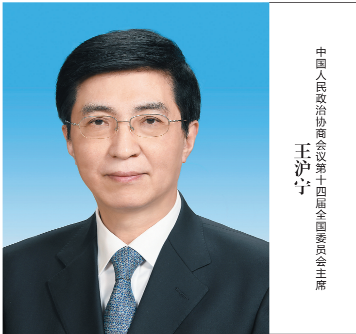
中国人民政治协商会议第十四届全国委员会主席 王沪宁

赵乐际,男,汉族,1957年3月生,陕西西安人,1974年9月参加工作,1975年7月加入中国共产党,北京大学哲学系哲学专业毕业,中央党校研究生学历。 现任中共二十届中央政治局常委,十四届全国人大常委会委员长。 (新华社北京3月10日电)