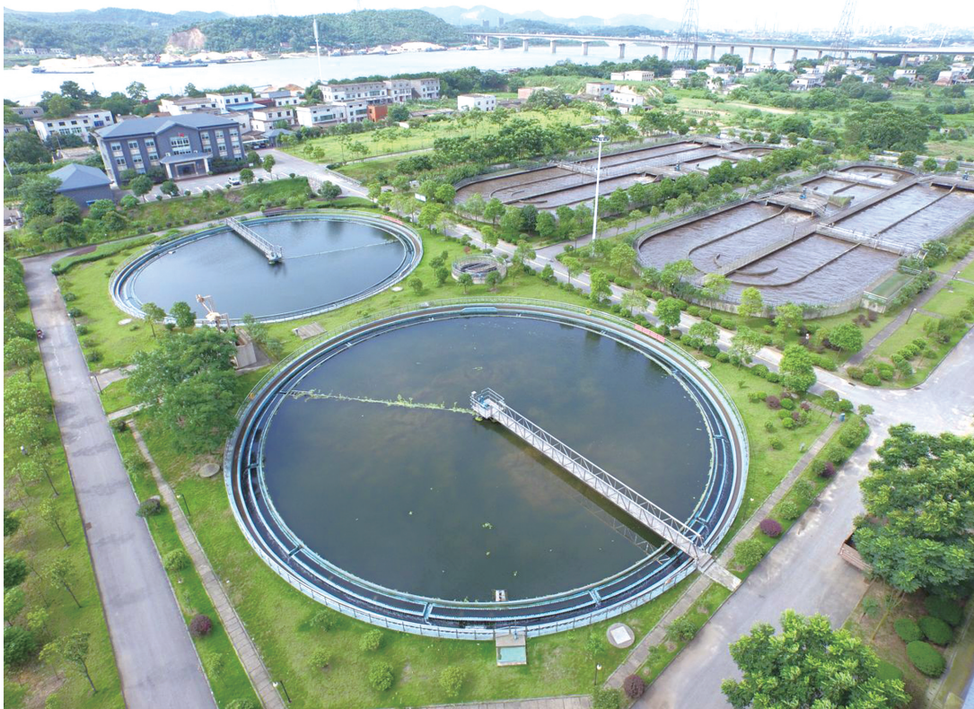
▲河西污水处理厂一期航拍图。通讯员供图

一项项民生实事在公司落为责任, 人水和谐的生态株洲画卷徐徐展开, 着力为人民、为株洲交上了一份满意的“环保答卷”, 在受到管理部门高度评价的同时, 也获得了群众的肯定与点赞。