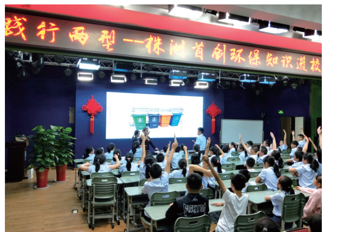
▲公司持续开展环保知识进校园系列宣教活动。

一个个脚印, 记录时代的温度; 一次次成绩, 助力株洲水清城净的蜕变。远望遥思, 首创人因水而生, 依水而兴。憧憬未来, 奋进新征程的号角已吹响。公司将立足水务行业, 践行“共建清洁、美丽、繁荣的幸福家园”的企业使命, 全力推进“首创生态+2025”战略落地落实, 打造产业新生态, 聚合、重构、孵化专业技术和服务能力, 继续初心恒往, 力争做好治理水环境、服务社会、造福人民的伟大事业, 为全面落实“三高四新”战略定位和使命任务, 加快培育制造名城、建设幸福株洲作出新的更大贡献。