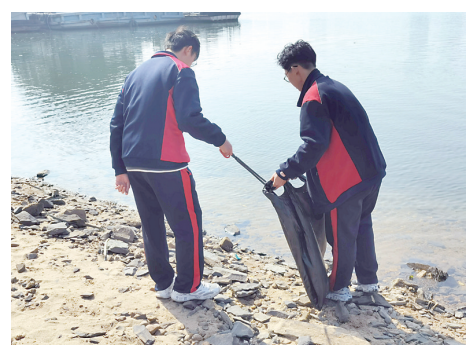
▲八中学子清理湘江边垃圾。

本报讯(株洲晚报融媒体记者/戴源 通讯员/曾思思)守护母亲河,关爱孤寡老人。连日来,株洲市八中学子利用课余时间开展丰富多样的志愿服务活动,争做“新时代 新雷锋”的践行者和引领者。