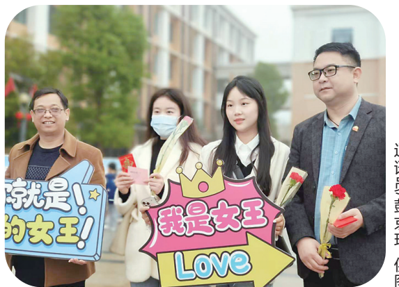
▲二中枫溪学校小学部西校区的女教师们为女教师送上鲜花的。