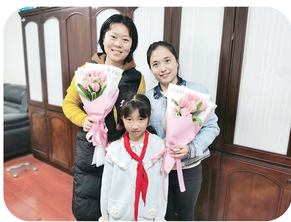
▲何家坳小学的同学自制手工花送给老师。