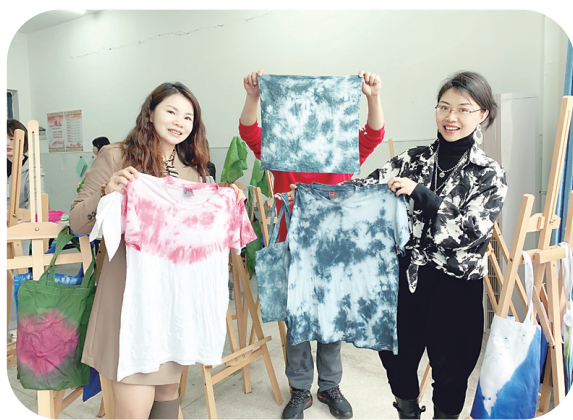
▲白鹤溪中学组织女教师开展扎染文化活动。

据了解,有的学校还为女教师组织了扎染、茶艺、点心制作等特色手工艺教学活动,放松心情、陶冶情操。