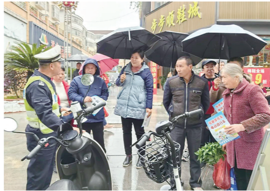
▲炎陵交警在人员密集的街头开展“春季攻势”宣传活动。

骑行摩托车要考证,这是无可质疑的。超标的电动车绝不是电动自行车,而是属于电动(轻便)摩