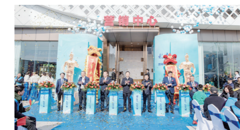
▲营销中心开放现场实景图。