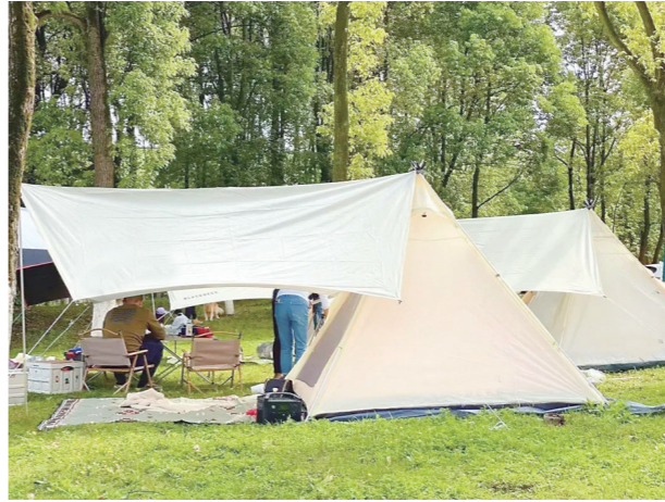
▲趁着周末，市民朋友走出动去动起来，“春日消费”逐渐升温。