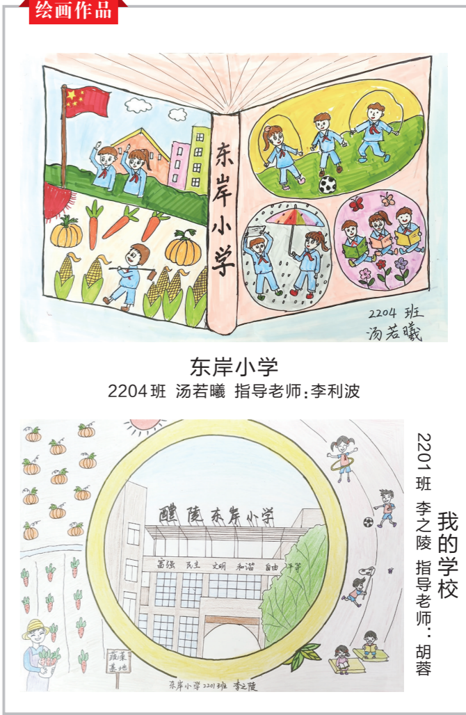
东岸小学 2204班 汤茗曦 指导老师:李利波