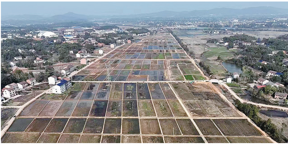
孙家湾镇文家湾村高标准农田。

株洲日报讯(全媒体记者/刘毅 通讯员/陈君 黄婷)春争日,夏争时。在醴陵市,田间地头农事催忙,农田建设热火朝天。2月27日,醴陵市孙家湾镇文家湾村高标准农田建设项目现场,工人们趁着天气晴好,平铺地块、修抽水泵站、建排水管网,铆足干劲抢抓工期。按照“田成方、渠相通、路相连、旱能浇、涝能排”的标准,文家湾村计划建设高标准农田4000亩,打造双季稻千亩示范片。现已完成田块整治948亩,山平塘6座,衬砌明渠(沟)15条。建成后,该项目区预计每年粮食增产200万公斤,其他农作物增产50万公斤,受益农民增收480万元。