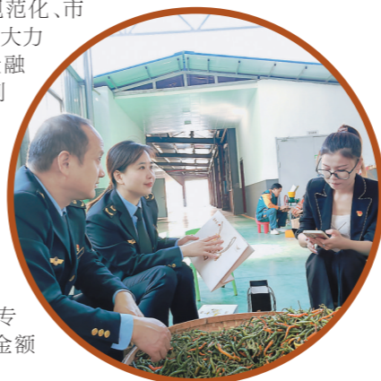
▲市市场监管局工作人员为“王十万黄辣椒”作地理标志产品工作指导。

15. 市文化市场综合行政执法支队检查石峰区某日用品店时,发现当事人用作游戏奖品的“冰墩墩”特许商品无法提供其合法来源。执法机关认定当事人的行为涉嫌侵犯奥林匹克标志的专有权利,可以依照《著作权法》的规定予以保护,于是给予当事人警告,没收违法所得并处罚款的行政处罚。