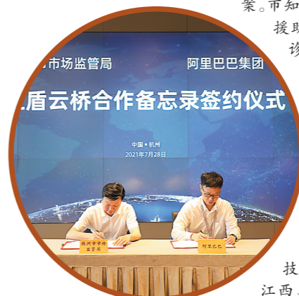
▲市市场监管局与阿里巴巴开展红盾云合作。