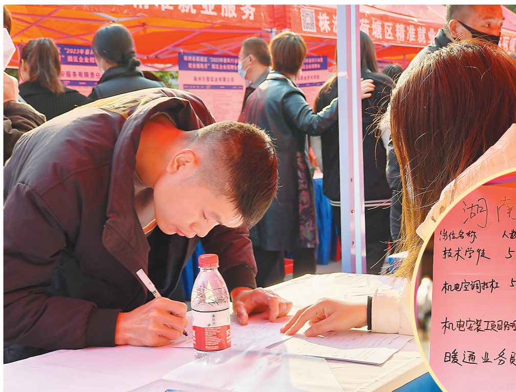
▲荷塘区“春风行动暨就业援助月”园区企业招聘会上,求职者正在填写资料。

株洲日报讯(全媒体记者/廖智勇 通讯员/廖恬恬) 21日上午,荷塘区第七届“春风行动暨就业援助月”园区企业招聘会在荷塘株百前坪举行,吸引了41家企业入场。就业服务专员在企业与求职者间“穿针引线”,成为招聘会亮点。