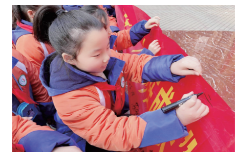
▲学生代表在“小栗树在成长之培养好习惯”横幅上签名。

本报讯（株洲晚报融媒体记者/颜家萍 通讯员/罗湘娟）为了把立德树人贯穿教育全过程，提升学生综合素养，培养良好的行为习惯，让德育走入学生的心灵，2月20日上午栗树山小学举行了“小栗树在成长之培养好习惯”主题教育活动暨“种十佳好习惯，做文明小栗树”启动仪式。