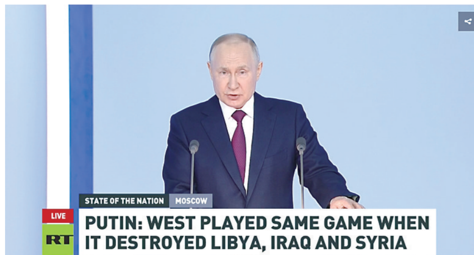
▲普京发表国情咨文。视频截图

当地时间2月21日，俄罗斯总统普京向俄联邦议会发表2023年度国情咨文，再度阐明俄军在乌克兰开展特别军事行动的目的，并强烈批评美国和西方。普京同时强调，要“在战场上战胜俄罗斯，是不可能的”。此次国情咨文，由普京亲自撰写，这是俄军在乌开展特别军事行动以来，其首次发表国情咨文。