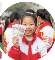
▲领到稿费开心极了。