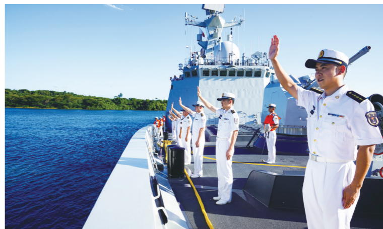
2月19日,在南非理查兹湾,海军第42批护航编队官兵向欢迎人群挥手致意。

据海军政治工作部干部局有关负责人介绍,舰载机飞行员是航母战斗力的核心,随着海军转型建设加快推进,对舰载机飞行人才需求更加迫切,扩大选拔范围,改进选拔手段,有利于从人才建设起点上优化飞行军官结构,夯实职业发展基础,提高人才培养质效。该负责人表示,期待热爱国防、矢志海空、素质全面的优秀青年加入舰载机飞行人才方阵。 海军2023年度招飞简章已公布,符合条件的对象可登录中国海军招飞网上报名,并按初检预选、全面检测、定选录取的程序,参加各项选拔考核。海军将先后在河南郑州、山东潍坊等地设站组织选拔考核。