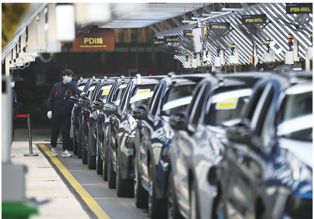
一月20日,工人在领克汽车浙江余姚工厂总装车间进行车辆下线前的检查工序。

新华社北京2月20日电 工信部、交通运输部会同相关部门印发通知,在全国范围内启动公共领域车辆全面电动化先行区试点;商务部明确引导各地在牌照、充电、通行等各个方面,进一步优化新能源汽车使用环境;继续扩大二手车流通,加快建设完善全国性的二手车信息查询平台……连日来,鼓励和支持新能源汽车发展的政策不断推出。 新能源汽车既是汽车产业发展的大势所趋、新动能的重要支撑点,也是稳工业、稳经济的重要力量。中国汽车工业协会副秘书长陈士华认为,当前,我国新能源汽车逐步进入全面市场化拓展期。政策持续加力有助于产业克服多因素影响,保持稳健发展势头,巩固优势地位。 走进4S店,新能源车摆在“黄金展位”,吸引消费者的目光;企业车间里,自动化生产设备忙碌作业;工厂外,一辆辆新车上滚装船,走向海外市场。 近年来,国内新能源汽车产业发展迅速。据中国机械工业联合会统计,2022年,我国新能源汽车产销量分别完成705.8万辆和688.7万辆,产销量同比增长均超过90%。海关总署公布数据