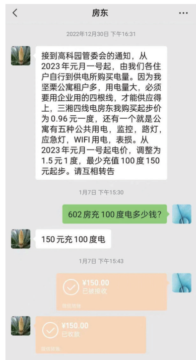
▲张先生与房东的聊天记录。

记者还了解到,12345热线接到相关投诉后,已于13日交办到芦淞区政府,相关部门正在对此事进行调查。