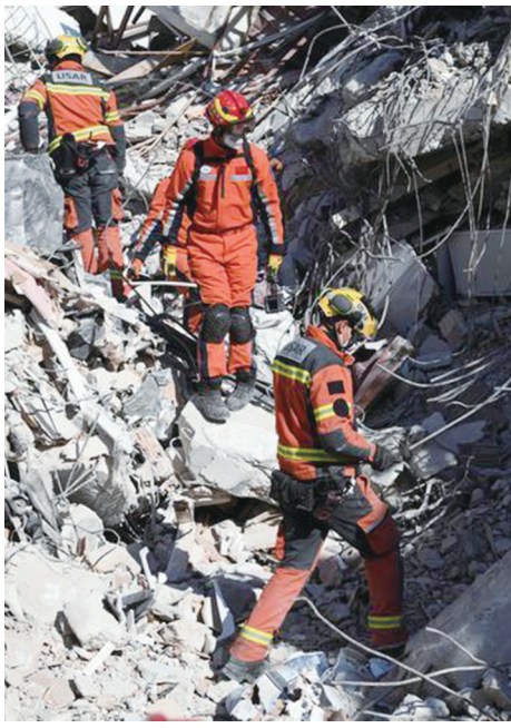
▲2月14日,中国救援队与中国香港救援队联合行动。

当地时间2月14日,正在土耳其搜救的中国救援队共派出3个批次、40名救援队员、2只搜救犬,在安塔基亚市24小时不间断开展搜救行动。其间,中国救援队与中国香港特区救援队联合编组,与当地救援力量及重型机械协同作业,共搜寻出3名遇难者,搜索评估了12栋建筑。截至目前,中国救援队共营救6名被困人员,搜寻出11名遇难者,搜索评估建筑82栋。