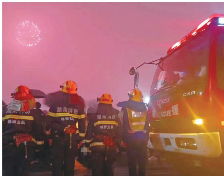
元宵节,守候在焰火释放现场的消防员。

他戴上头盔和面罩,我看不清他的脸庞,我依然能听到,他那炙热有力的心跳。大火熊熊、危难降临,一个电话,他就能到你身边,这就是中国消防员!