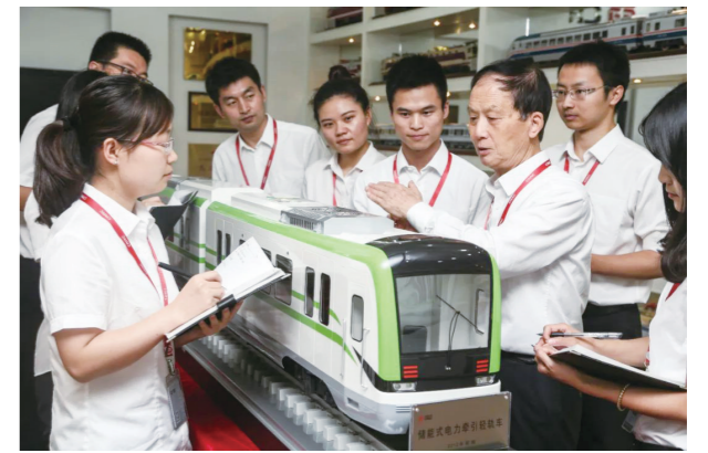
刘友梅院士(右三)在工作中。