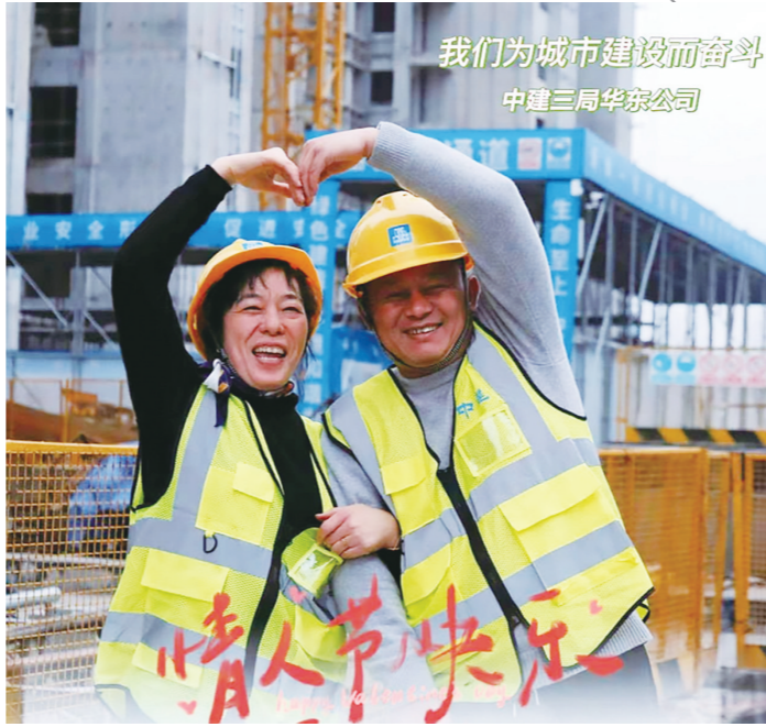
我们为城市建设而奋斗 中建三局华京公司