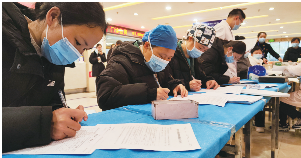
株洲恺德心血管病医院开展无偿献血活动现场。