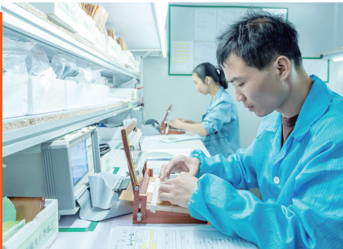
▲株洲晶彩电子科技有限公司内,员工正在忙碌。