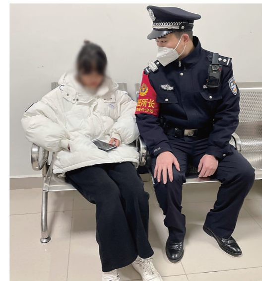
▲民警耐心劝说离家出走的小芹。

本报讯(株洲晚报融媒体中心记者/肖蓉 通讯员/杨春风 杨浩诚)近日,因学习问题与爸爸发生争执,15岁女孩小芹(化名)从柳州负气离家出走,在株洲站派出所民警的温情劝说下,父女重归于好,女孩平安回家。