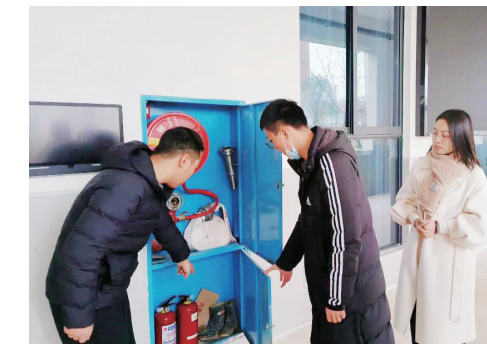
树立安全意识,着力补齐短板,抓实抓细安全工作,为师生们营造安全、舒心、放心的校园环境。