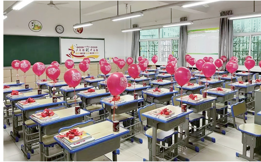
天元区建宁实验小学为欢迎新学期学生返校,准备了系列礼物,愿孩子们在新学期越来越优秀。

本报讯(株洲晚报融媒体记者/孙晓静 通讯员/李吉 关好)春雨绵绵中,又到一年开学时。今日,我市所有中小学将正式开启新学期。为了迎接久违的学子们,全市各中小