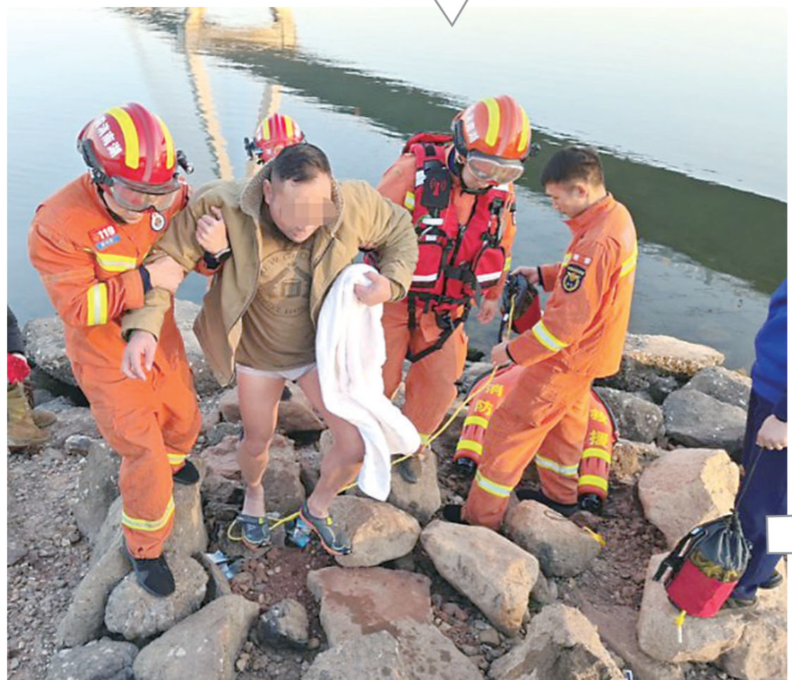
▲男子被救上岸，救援人员还攥着漂浮绳。

本报讯(株洲晚报融媒体中心记者/马文章 通讯员/曾美丽)“太感谢你们了,下次不敢贸然下河野泳了。”1月30日17时许,建宁大桥附近水域,一名40多岁的男子被困河水中,幸亏了消防队员及时赶到才化险为夷。