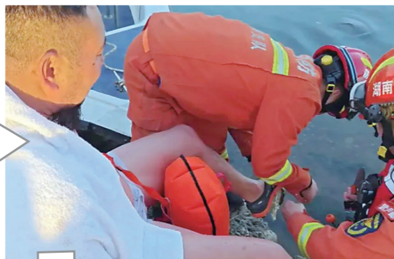
▲消防队员在拆解男子脚上的渔网。