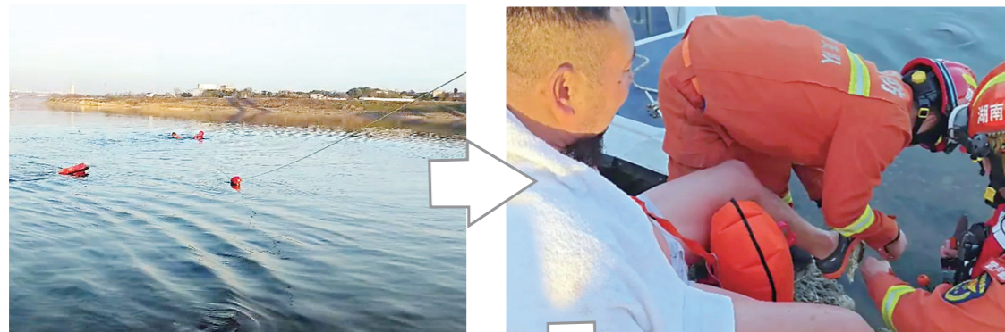
▲消防队员系上漂浮绳下水救人。