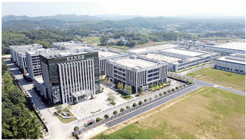
已经落成的航空城科创园二期。