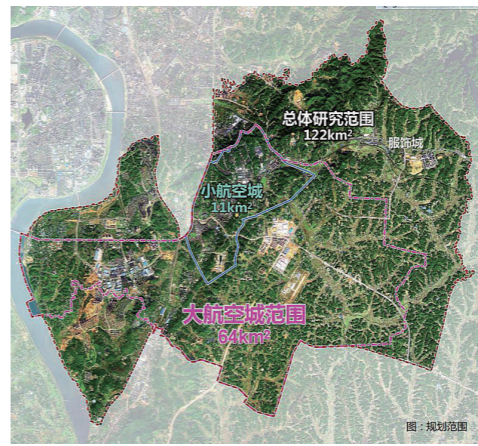
规划研究范围图。