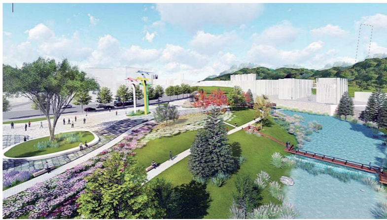
枫溪风光带建设方案效果图。