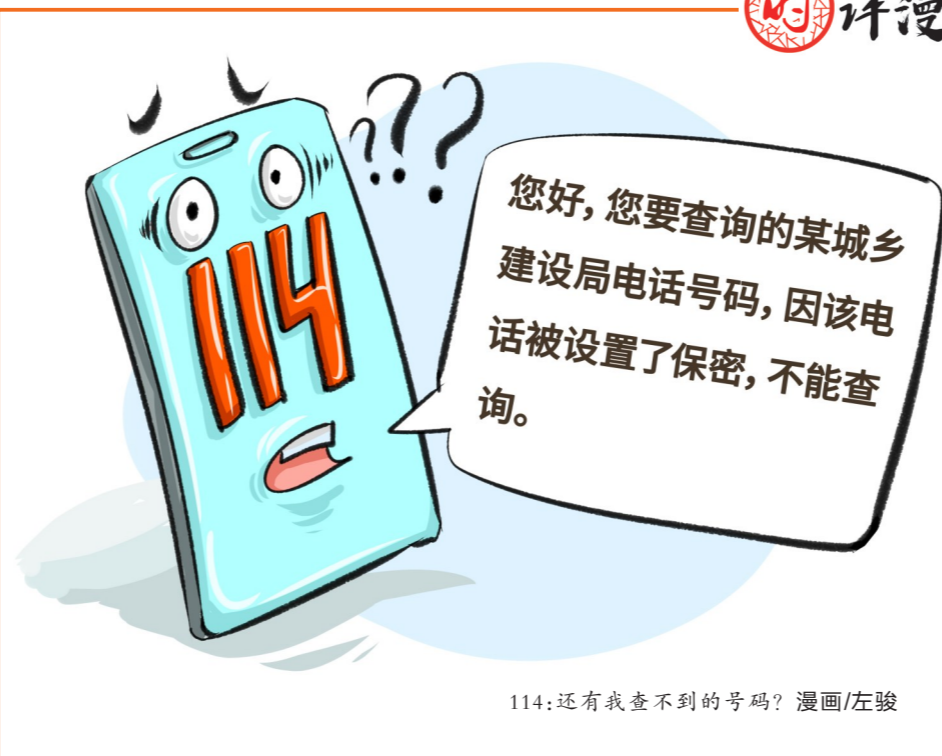
114:还有我查不到的号码? 漫画/左骏