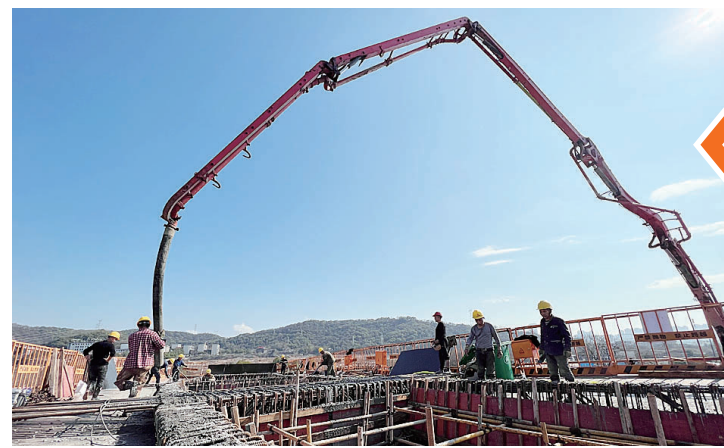
打模、灌浆、填平,石峰大桥东匝道施工如火如荼。

二十分钟不到,物料到位,小伙子们说有了笑上楼给钢筋“打结”。项目推进一月不到,“我们升级了。从桥底干到了桥