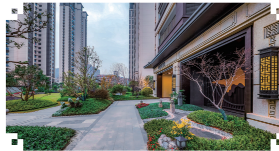
▲株洲建发央著小区实景图。

1月7日至9日，株洲建发央著举行品质交付区开放日活动，特邀一期业主及媒体代表等嘉宾到场，零距离感受新房品质，并广纳业主修正意见，以便改进雕琢，率先开创株洲楼市的“预交付”模式，以与城市共建共生的责任态度，用最大诚意，最高品质交付兑现业主托付的幸福期许。