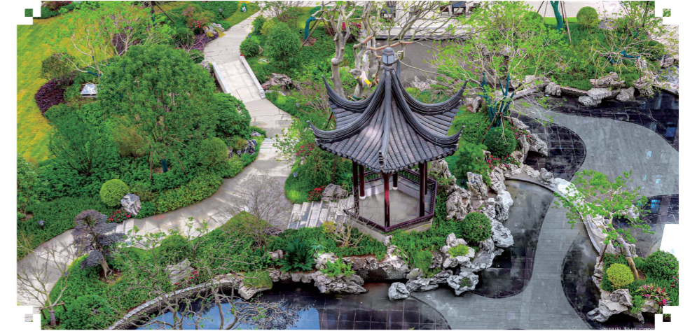
▲株洲建发央著小区实景图。

浪潮退去，方知谁是强者。2022年，疫情反复、市场环境艰难，增加了企业正常运行的难度，也让房地产行业承受了更多压力。在充满不确定性的环境之下，部分房企亮起红灯，深陷兑现风波。于是，越是在楼市的逆境之中，越是能看出一个楼盘的秉性和品格。