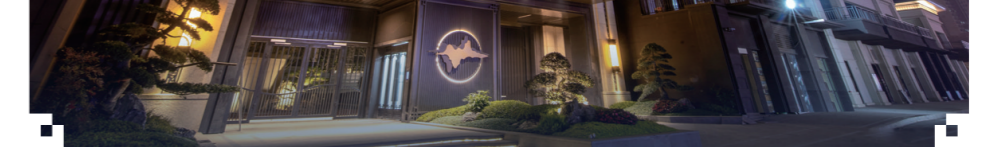
▲株洲建发央著入户大门实景图。

特别是在如今这样的楼市大环境里，还能坚守工程品质和保障施工进度，逆市实现提前交房交证，用四个字形容：难能可贵！相信拥有匠心的建发央著，在后续交付工作中也能继续“乘风破浪”，“满分交付”！（文/刘春华）