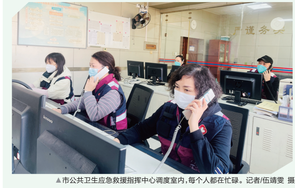
▲市公共卫生应急救援指挥中心调度室内，每个人都在忙碌。