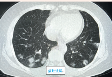
▲7天左右,病灶显示达到峰值,甚至出现重症肺炎(俗称白肺;肺部炎症广泛浸润)。