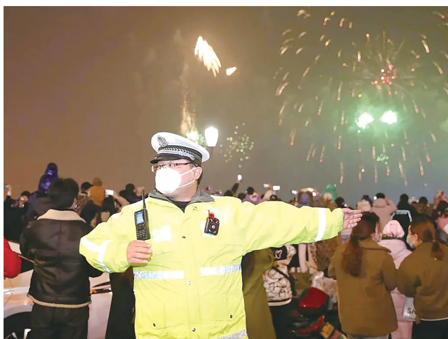
疫情防控进入新阶段，公安民警守护平安不放假。