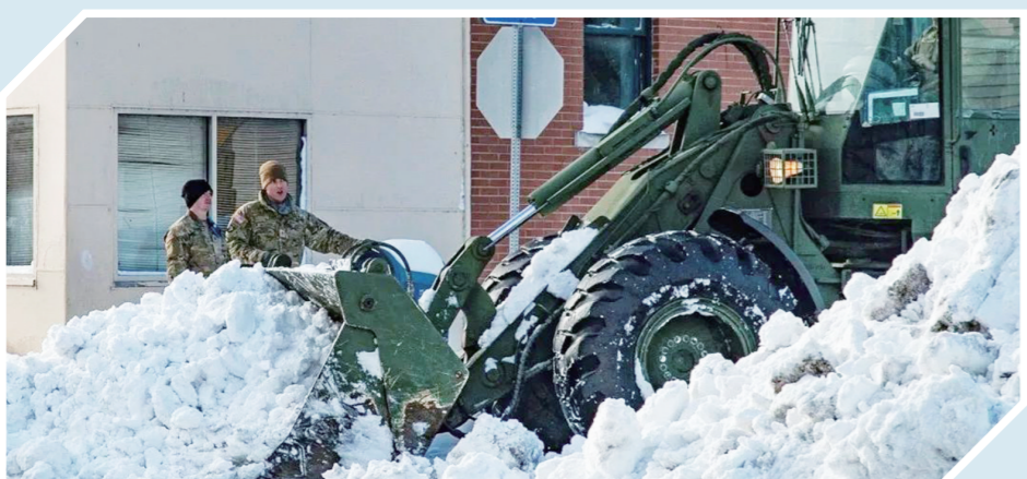
▲当地时间2022年12月28日,美国布法罗,美国国民警卫队在一场创纪录的冬季风暴后协助恢复工作。