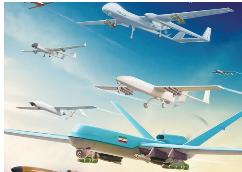
▲伊朗部分无人机展示。

伊朗研制的无人机近年来在各种场合频频“露脸”,且呈现出加速发展态势。目前,伊朗装备有“鹞猫”垂直起降无人机、“阿拉什”自杀式无人机、“燕子-4”中型察打一体无人机、“见证者-129”察打一体无人机、“雷电”隐身无人攻击机等。从无到有、从低到高,着手打造性能可靠、功能互补、性价比比较高的“无人机军团”,不少外媒以“异军突起”来形容伊朗无人机的发展,并对该国生产的无人机冠以“空中波斯弯刀”的名号。