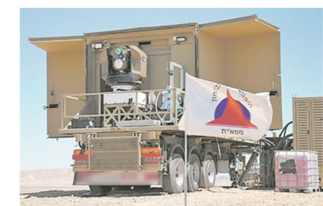
▲图为“铁束”激光防空系统。

于是,“铁束”激光防空系统应运而生,并在2014年新加坡航展上进行了首次公开展示。通过对激光进行“叠层”和“合束”,用所形成的强激光束拦截目标,发射次数不受限,拦截附带损伤小,每次拦截只需几美元,这些特点使“铁束”激光防空系统成为“低成本取胜”的代表性装备之一。根据以色列拉斐尔公司测试数据,“铁束”系统拦截成功率很高,数秒内即可摧毁空中移动目标,有效射程约7千米。显然,它有能力与“铁穹”系统高低搭配,对突破“铁穹”的“漏网之鱼”进行打击,从而为“铁穹”托底。但尺寸寸长,“铁束”也有“阿喀琉斯之踵”。既然是以激光为武器,它就易受云、雨、沙尘暴、雾霾等自然条件影响。这种恶劣天气将导致激光束强度大打折扣,影响拦截效果;它的拦截距离也较短,且对速度大于300米/秒的目标,所能拦截的数目也较为有限。尽管如此,这种“光”与“弹”的结合,仍能较好地彼此取长补短,在一定程度上铸就低空防御“坚盾”,并给其他国家此类武器装备的发展带来启示。(文/图 摘编自中国军网)