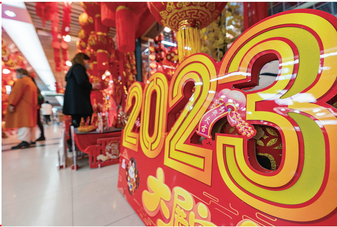
近日，位于云南省昆明市的新螺湾国际商城内节日饰品热销，红灯笼、春联、兔年生肖饰品等销售逐渐升温。这是2022年12月31日在昆明新螺湾国际商城内拍摄的新年饰品。