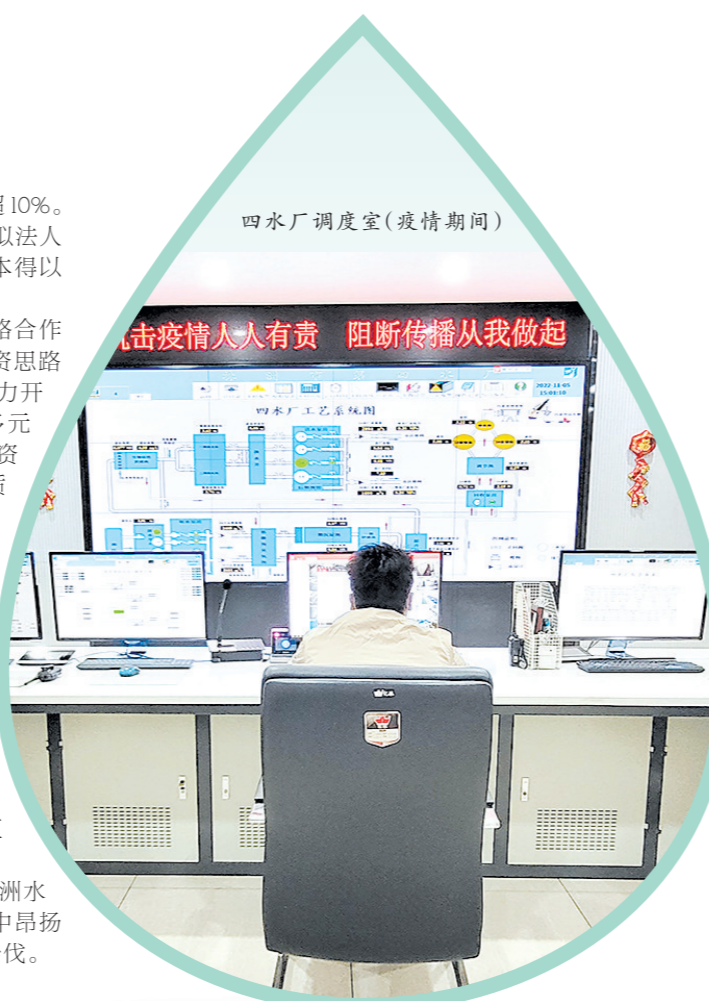
四水厂调度室(疫情期间)

一项项改革举措激活了株洲水务集团发展内生动力，于荆棘中昂扬精神力量，在砥砺中坚定追梦步伐。