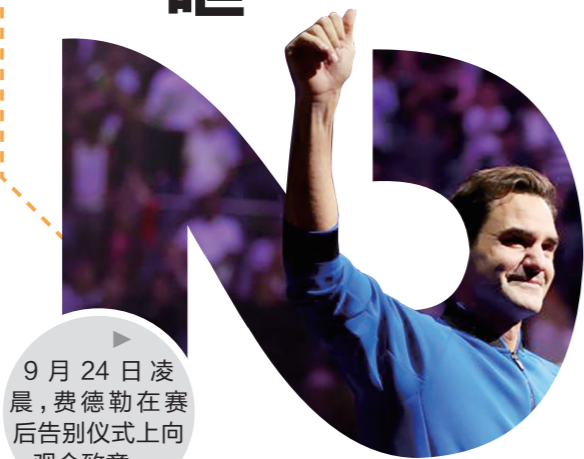
9月24日凌晨,费德勒在赛后告别仪式上向观众致意。