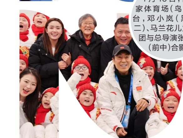
1月15日,在国家体育场(鸟巢)后台,邓小岚(黑衣左二)、马兰花儿童合唱团与总导演张艺谋(前中)合影。