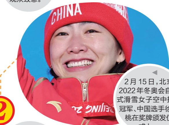
2月15日,北京2022年冬奥会自由式滑雪女子空中技巧冠军、中国选手徐梦桃在奖牌颁发仪式上。