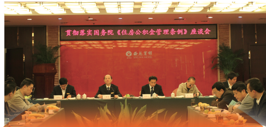
▲2010年贯彻落实国务院《住房公积金管理条例》座谈会。

今年，是株洲市住房公积金管理中心正式挂牌成立的20周年，也是住房公积金系统不忘初心续写住房公积金事业新篇章的关键之年。我市自建立住房公积金制度起，历经20年的探索与发展，制度从无到有，规模从小到大，住房公积金已经成为保障民生、助力广大缴存职工解决住房问题、改善住房条件的重要依靠。忆往昔栉风沐雨，开新局奋蹄疾驰。株洲住房公积金中心用20年时间，砥砺前行，勇往直前，交出了一份亮丽的时代答卷。