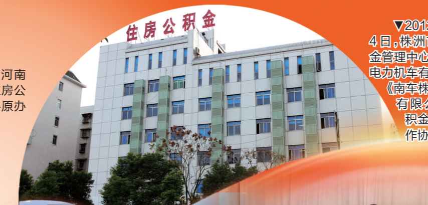
▼2012年12月4日，株洲市住房公积金管理中心与南车株洲电力机车有限公司签订《南车株洲电力机车有限公司住房公积金移交接收工作协议》。