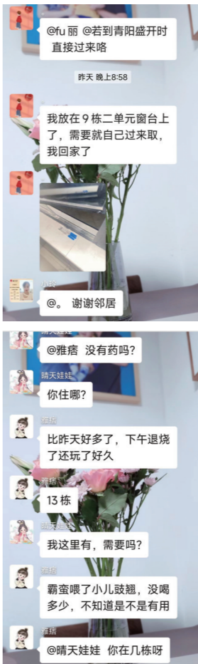
▲邻居在业主群发布求药信息,大家马上开启“接龙式”回复,互帮互助。

病毒无情,邻里有情。邻里之间的一盒药、几片退烧贴、一瓶消毒酒精犹如冬日暖阳温暖着彼此。大家一起鼓劲加油,共同度过这段日子。