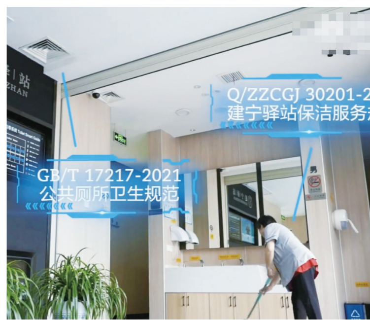
建宁驿站里的各种标准化规范。

2022年全国“标准化+”原创视频作品征集活动结果揭晓，株洲市拍摄的短视频——《株洲娃娃你看身边的标准化系列》建宁驿站/智轨篇，一举夺得全国一等奖。文字、图片、视频/标准生活官方微博