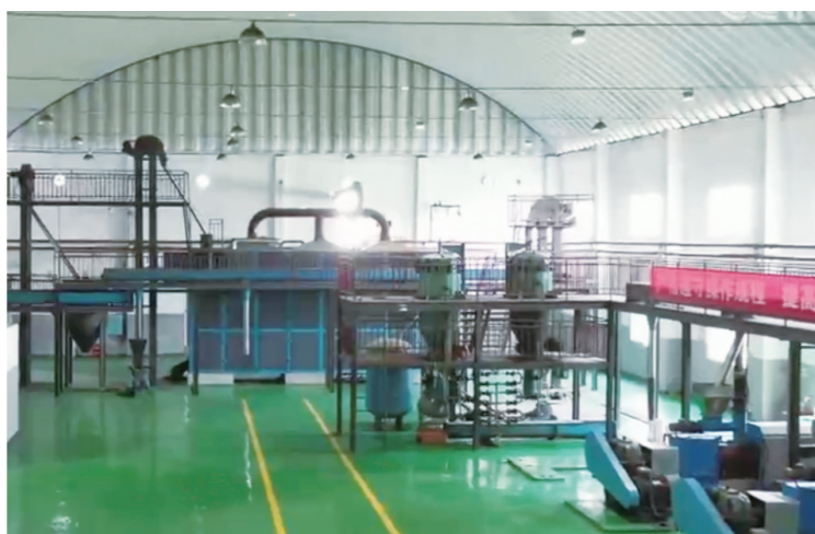
茶陵县一处油茶果榨油设备。

山茶油，一种深受食客喜爱的食用植物油，晶莹剔透的外观，醇厚清香的口感，辅以各种食材，简直让人垂涎欲滴。从油茶果到山茶油的华丽变身，究竟需要哪些玄机？