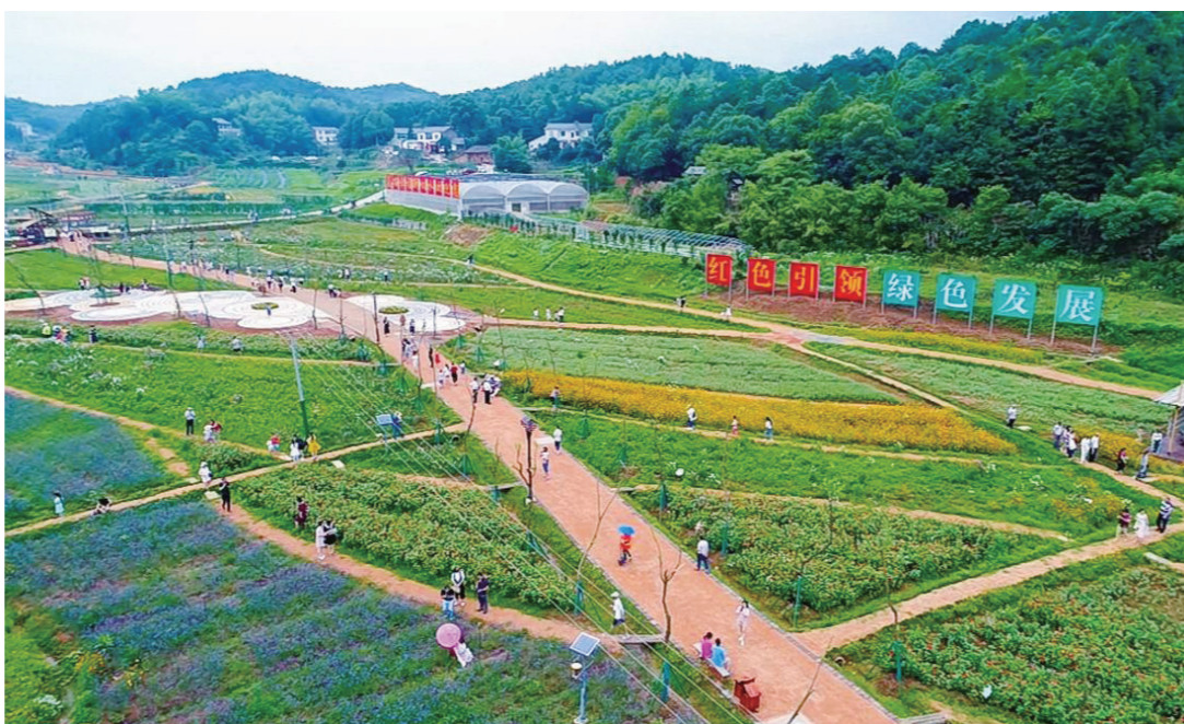
石三门现代农业公园。

近年来，天元区以三门镇、雷打石镇为核心推进美丽乡村建设，打造以响水国家级田园综合体为核心的石三门现代农业公园，构建了“北有动力谷，南有石三门”的区域战略发展格局，城区与农村相互支撑，比翼齐飞。 图片/李茂春 文字、视频/学习强国