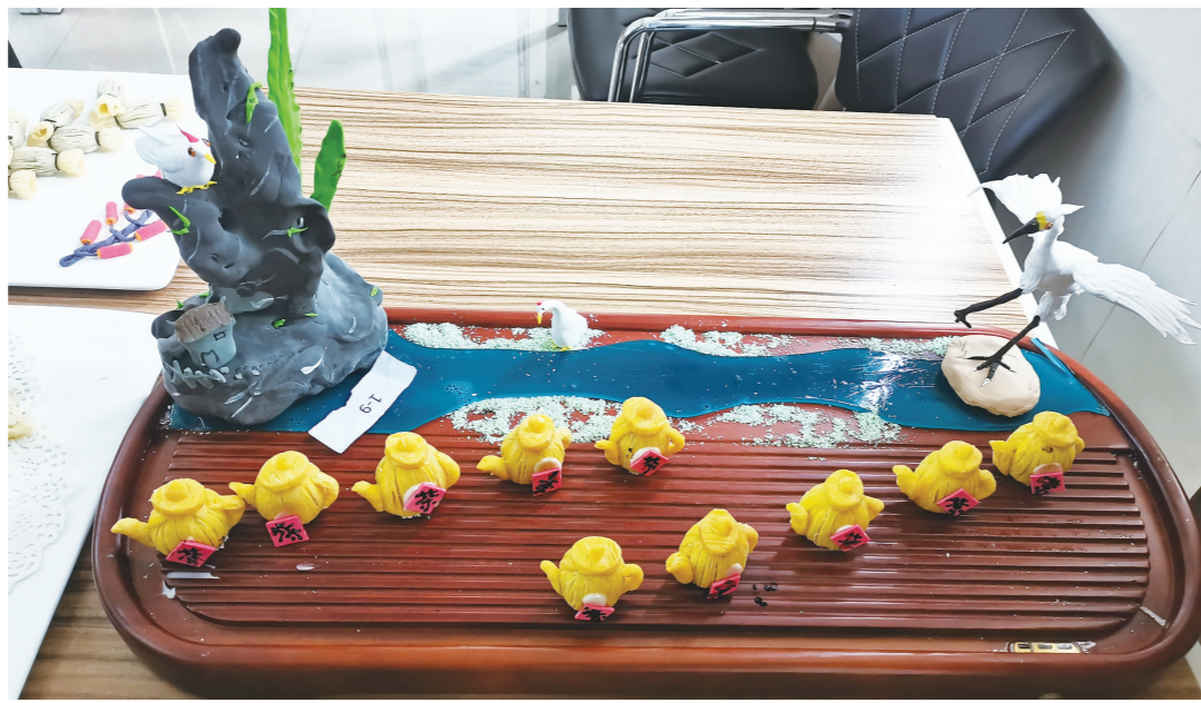
参赛选手精美的作品展示。

株洲日报讯(全媒体记者/刘毅 通讯员/刘斌)日前，醴陵市慈善会携手青山慈善基金会开展走访慰问活动，为该市257名困境儿童发放51.4万元善款。 关爱儿童就是守护未来。通过前期调查走访，该市慈善会核实了75名孤儿和182名事实无人抚养儿童的情况，青山慈善基金会决定给予每人2000元的资助。善款通过线上发放后，该市民政局组织工作人员对受助家庭进行走访，了解资金是否发放到位、家中还有什么困难需要解决等情况，为少年儿童茁壮成长创造有利条件。 “把救助金用到孙女身上，好好培养她。”“我要让孩子懂得感恩，他的成长离不开党和政府及社会的关爱。”受助儿童的亲人如是表示。 爱心人士负责人表示，将继续加强联系，保持一如既往地关注，帮助解决困境儿童更多生活难题。